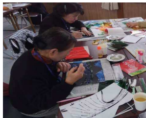
三和サロン:影絵製作