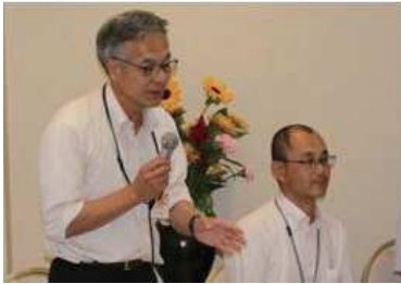
○第 1 回:「宮島口のまちづくりについて」