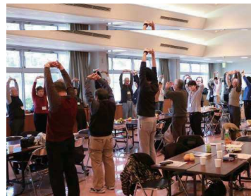
三サロン合同イベント:健康体操