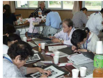
三和サロン:切り絵に取り組む