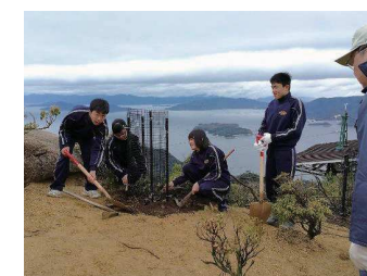
獅子岩駅周辺の植生回復事業