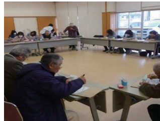
丸〇サロン:認知症予防のための訓練