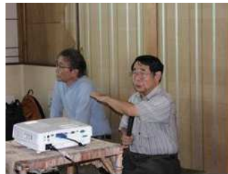
○第 4 回:「興動館教育プログラムの試み ～学生と地域社会との関わり～」