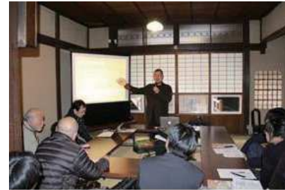
○大学連携による学生の観光に関する研究・活動発表会への参加