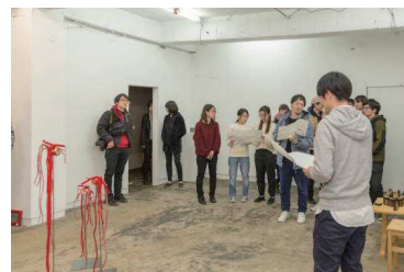
「パンドラの匣庭」展 オープニング