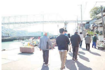
三サロン合同イベント:豊島散策