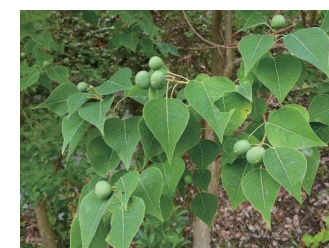
ナンキンハゼの果実