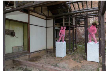
「パンドラの匣庭」展 展示(1)