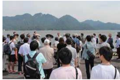
○第 2 回:「重伝建地区制度の役割とまちづくり—湯浅町湯浅(和歌山県)の事例から—」