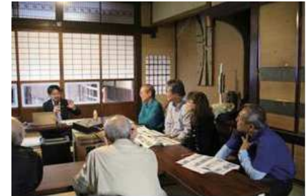
○第 6 回:「まちづくりのマネジメントと大学生の挑戦」 「宮島・土曜講座 2017 を振り返って」