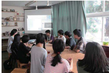
スライドレクチャー