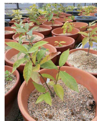
植栽に利用した宮島産種子由来の苗