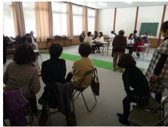
三和サロン:学生による健康相談