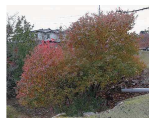
新たに生育が確認された外来種(ナンキンハゼ)