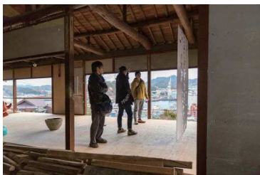
「パンドラの匣庭」展 展示(2)