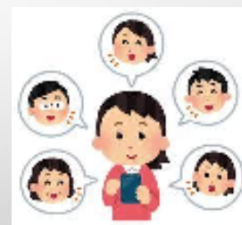
平和の映画祭 SNSで拡散