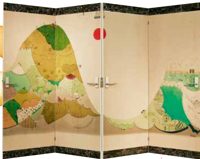
ドアが屏風に変身