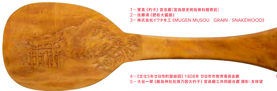
4- 《文化5年廿日市町屋絵図》1808年 廿日市市教育委員会蔵 5- 大谷一翠《厳島神社社頭乃園大杓子》宮島細工共同組合蔵