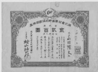
広島野球倶楽部株券