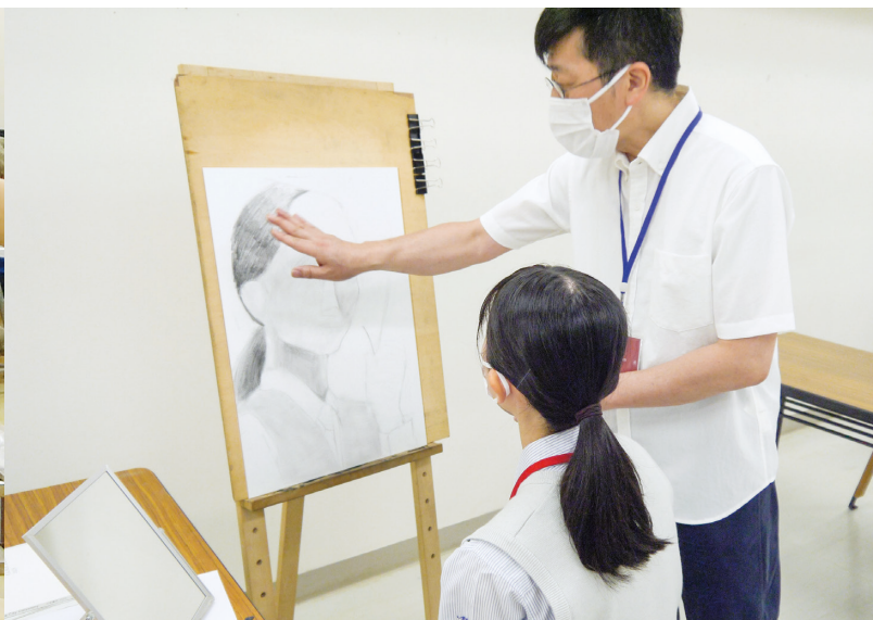
エ デザイン工芸学科